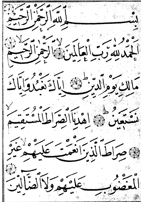
Şeyh Hamdullah Mushafı, İstanbul Üniversitesi Kütüphanesi, nr. AY6662